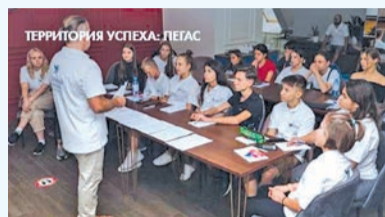
Проект «Территория успеха: Пегас»

К участию в ежегодных детских творческих проектах «Территория успеха: Пегас», «Территория успеха: мультиКЛИПация», «Территория успеха: Мода» и «Территория успеха: в объятиях природы» приглашаются школьники, проживающие в городах присутствия предприятий «Росатома».