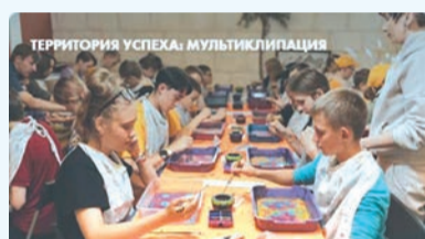
Проект «Территория успеха: мультиКЛИПация»

Для участия в конкурсном отборе ребятам необходимо прислать до 14 апреля свои рассказы, стихи, рисунки, а также видеозаписи чтения стихов или прозы. Авторы лучших работ получат возможность поехать с 12 по 30 августа на «Литературную смену» в Красноярск, где будут учиться работе со словом, изучать техники живописи, ставить театральные постановки под руководством опытных режиссеров.