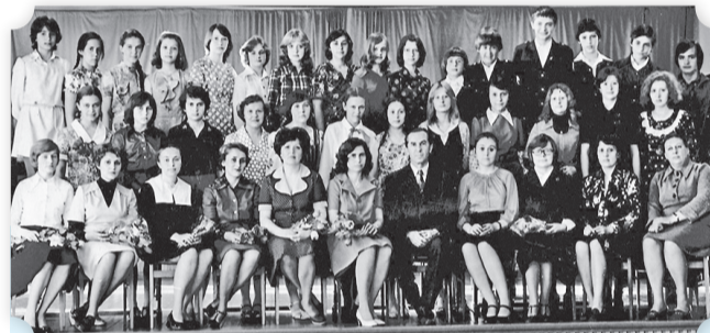
Первый выпуск ДМШ